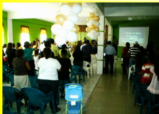
Vista general de la Reunión de Aniversario

Acompañados de Pastores de miembros de la Junta Directiva y de la Región 2 y otros invitados especiales, los hermanos de la Iglesia A.V. Baracoa celebraron el pasado 5 de Junio su primer aniversario.